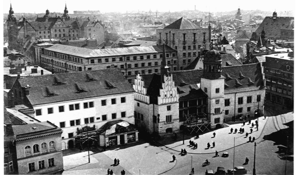
Ratswaage (links, z.Zt. Kaufhof-Erweiterung), Altes Rathaus (rechts), Ratshof (dahinter) um 1930