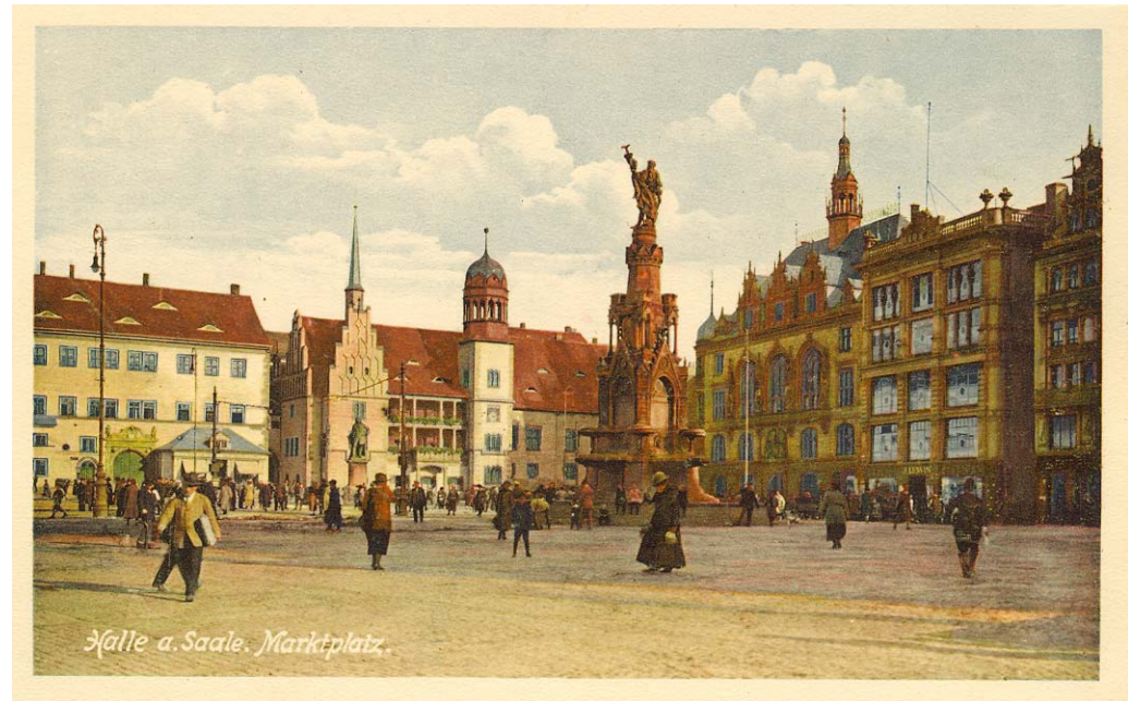
Historische Ansichtskarte: Ratswaage (links), Altes Rathaus (Bildmitte)