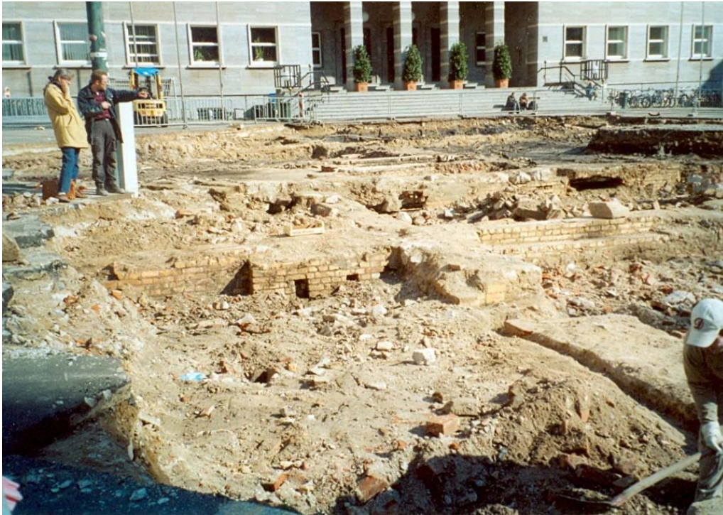
Grundmauern des Alten Rathauses, 2004 vor der Neupflasterung des Marktplatzes teilweise freigelegt